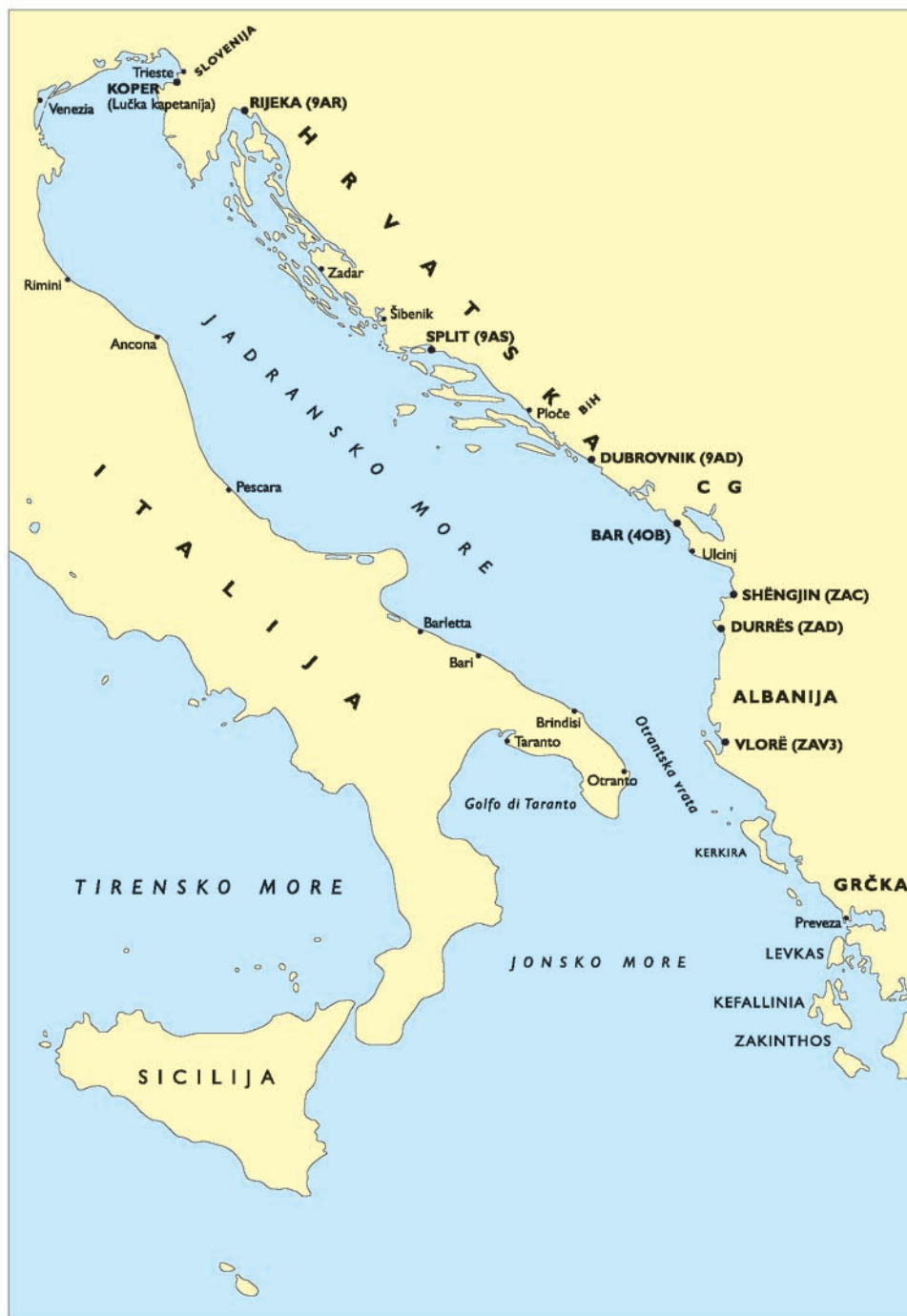
KUPON BR. 3 za RADIOSLUŽBA ZA POMORCE, slika 1, Obalne radijske postaje u Jadranskom moru (E), str. 19.